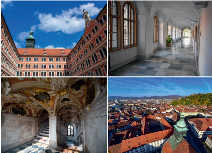
Priesterseminar Graz