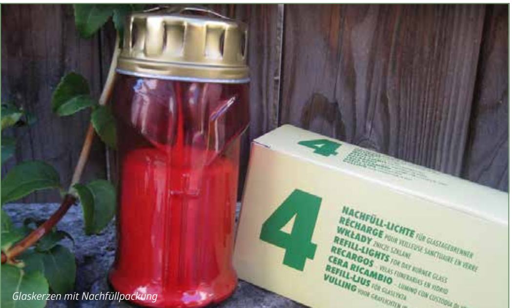
Glaskerzen mit Nachfüllpackung

Mittlerweile werden viele LED-Grablichter gekauft. Das entsprechende Bewusstsein, dass diese am Ende ihrer Leuchtzeit Elektronik-Altgeräte sind, muss erst entstehen. Am Friedhof dürfen sie nicht in den Mülltonnen für Kerzen landen. Die enthaltenen Batterien gehören zur Altbatterien-Sammlung!