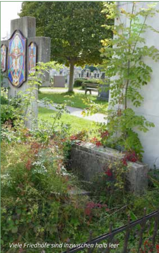
Viele Friedhöfe sind inzwischen halb leer

In der nachnapoleonischen Zeit wich der Gleichheitsgedanke der einheitlichen Reihengräber allerdings wieder einem Standesdenken über den Tod hinaus. Reiche