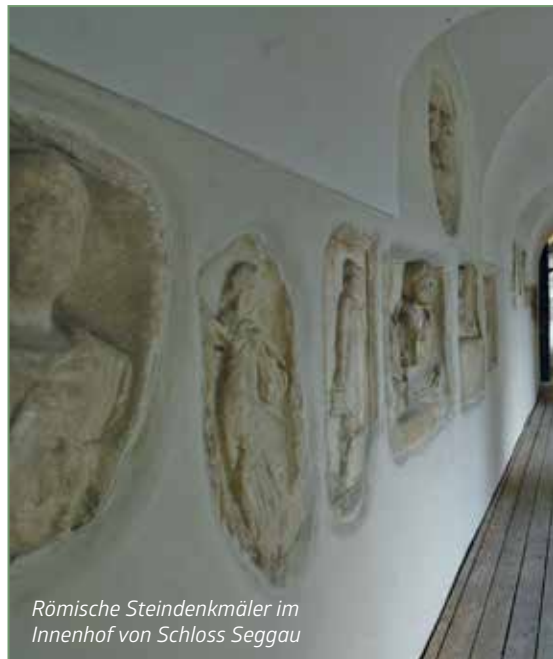
Römische Steindenkmäler im Innenhof von Schloss Seggau

Die Regel war jedoch, dass prominente und reiche Bürger innerhalb der Stadtmauern ein pompöses Grabmal erhielten: auf öffentlichen Plätzen und Märkten oder auch außerhalb der Stadt, an Landstraßen. So entstanden in Rom entlang der berühmten Via Appia viele solcher Ehrengabmale. Für Arme und Sklaven wurden ausgebeutete Stein- und Tongruben zur letzten Ruhestätte. Wer kein Geld für eine kostspielige Leichenbestattung hatte, wurde eingeäschert.