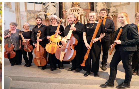
Fotorechte: Oksana Pavlychko, St. Thomas Consort Horn Astrid